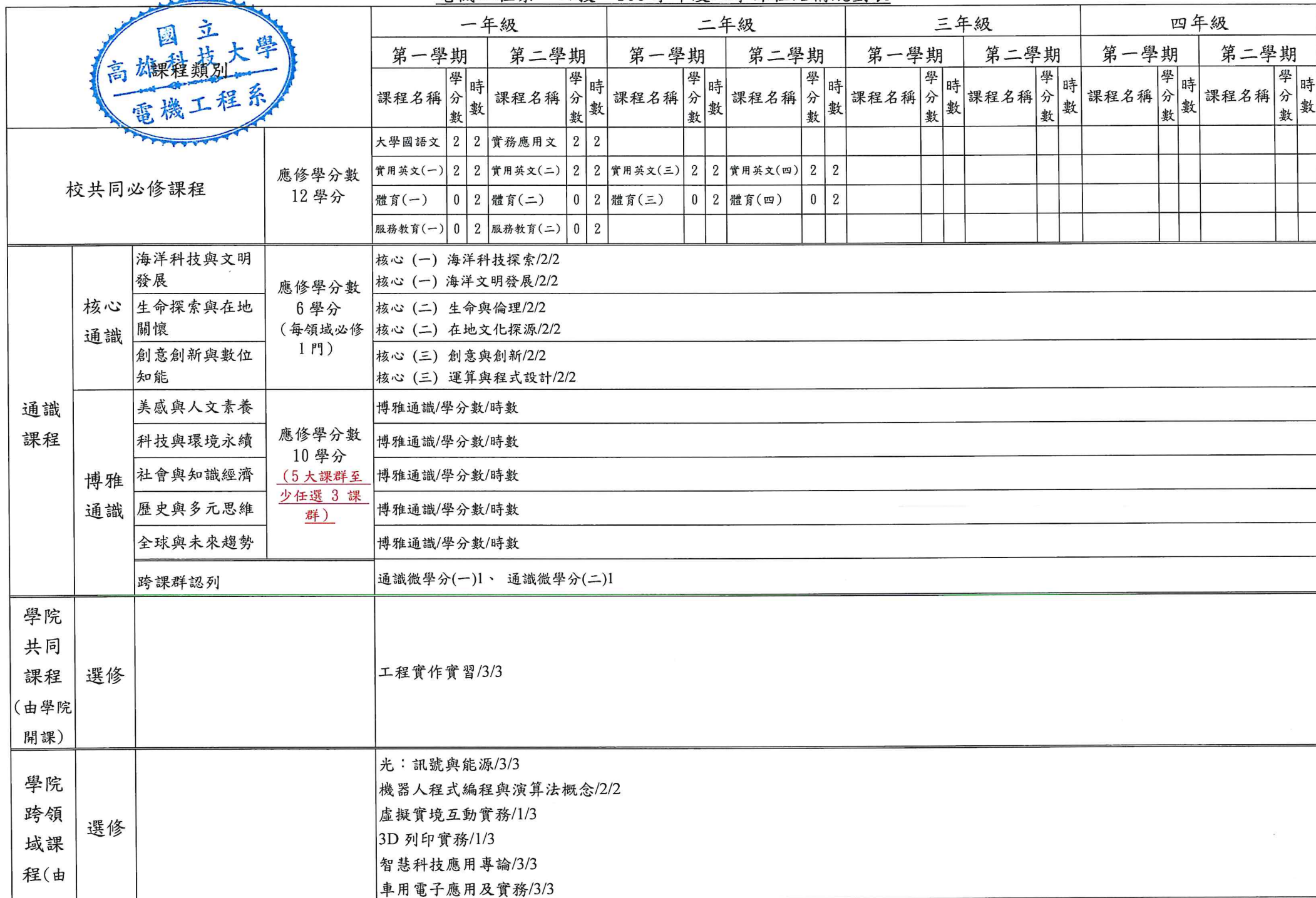
電機工程系 四技 109 學年度入學課程結構規劃表