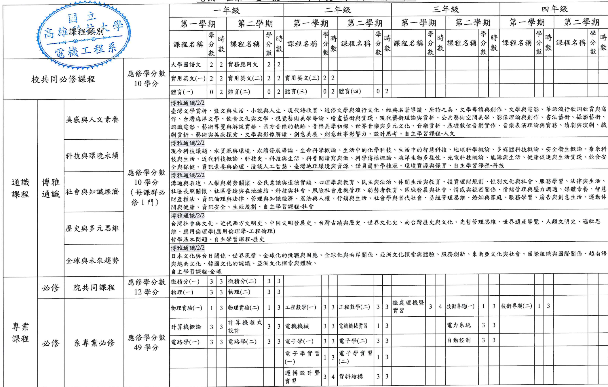
電機工程系 進四技 107 學年度入學課程結構規劃表